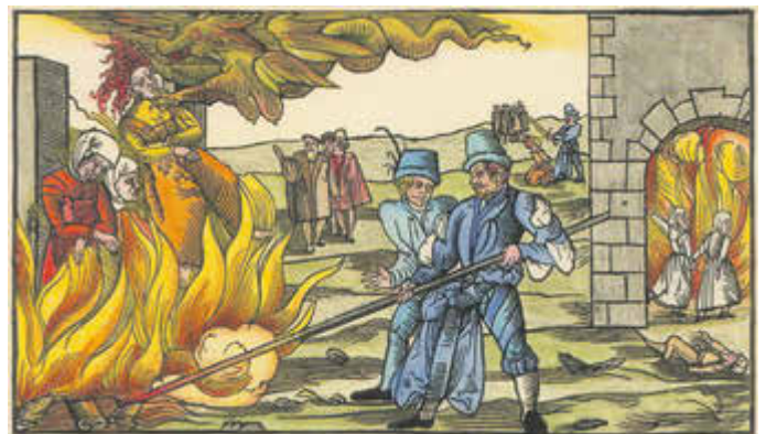
Einblattdruck zu einer Hexenverbrennung in Derenburg 1555